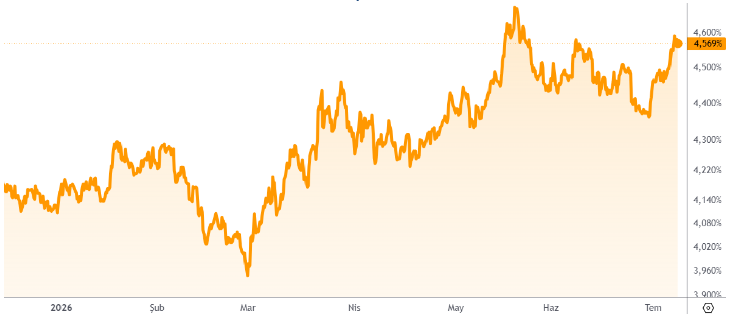
ABD 10 yıllık tahvil faizi

Değerli metaller – Perşembe gününe geldiğimizde altın ve gümüşe yönelik piyasa görüşümüzde bir değişiklik bulunmuyor. Değerli metallerde kademeli alım yaklaşımımızı koruyor ancak henüz net bir yükseliş sinyali görmediğimiz için temkinli hareket etmeyi sürdürüyoruz. Yukarı yönlü yeni bir trendin başlangıcı adına ons altında 4.400, gümüşte ise 70 doların aşılması ve üzerinde kalıcı olunması gerekebilir. Düşüşün dengelenmeye başladığı noktada değerli metallerde bir süre konsolidasyon ağırlıklı bir fiyatlama da izleyebiliriz.