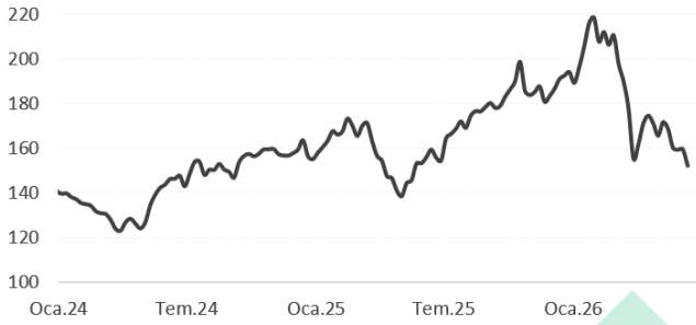
TCMB Brüt Rezerv milyar dolar

TCMB brüt rezervleri 12 Haziran haftasında 7,3 milyar dolar artarak 152,1 milyar dolar oldu. 12 Haziran itibariyle Net uluslararası rezerv 1,8 milyar dolar düşüşle 45,1 milyar dolara gerilerken, swap hariç net rezervler 2,8 milyar dolar artışla 29,4 milyar dolara yükseldi. Altın fiyatlarının %5,3 düştüğü haftada altın rezervi 6 milyar dolar düşüşle 99,0 milyar dolara geriledi; bu düşüşün 5,6 milyar doları altın fiyatındaki düşüşten kaynaklandı. 12 Haziran haftasında TCMB'nin 3,3 milyar dolar döviz alımı yaptığı hesaplanıyor.