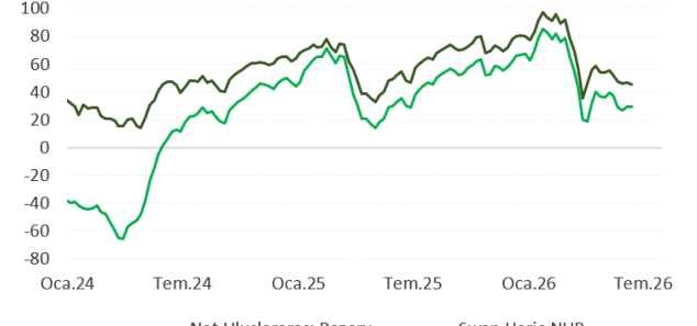
TCMB Net Rezervler milyar dolar