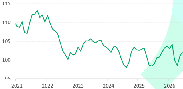
Reel Kesim Güven Endeksi Mevsimsellikten Arındırılmış

Kapasite kullanım oranı haziranda %74,3'e yükseldi. İmalat Sanayi Kapasite Kullanım oranı aylık 0,2 puan artışla %74,3 seviyesine yükseldi. Böylece kapasite kullanım oranı ikinci çeyrek ortalaması %74,1 ile ilk çeyrek ortalaması ile aynı gerçekleşti. İkinci çeyrekte üretici sektörlerde sınırlı da olsa toparlanma sinyallerinin güçlendiğini gösterdi. Sektörel bazda bakıldığında, diğer ulaşım araçları sektöründe KKO %78,4 ile yüksek seyrini korurken, makine ekipman %67,1, basım %68,9, deri %59,7, içecek %69,8 ve tekstil %70,4 ile düşük seyrine devam etti. Yatırım malları imalatında KKO haziranda %73,4'e yükselirken, tüketim malı ve ara malı imalatında kapasite kullanım oranlarının aylık ve yıllık bazda gerilediği görüldü.