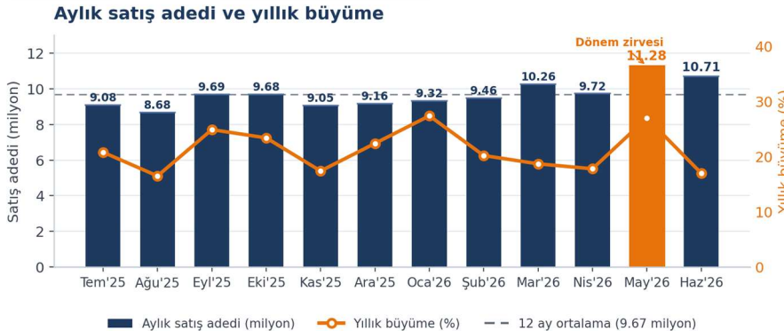
Grafik 1 – Aylık satış adedi (milyon, sol eksen) ve yıllık büyüme (%), sağ eksen). Turuncu çubuk: Mayıs 2026 dönem zirvesi; kesikli çizgi: 12 ay ortalama.