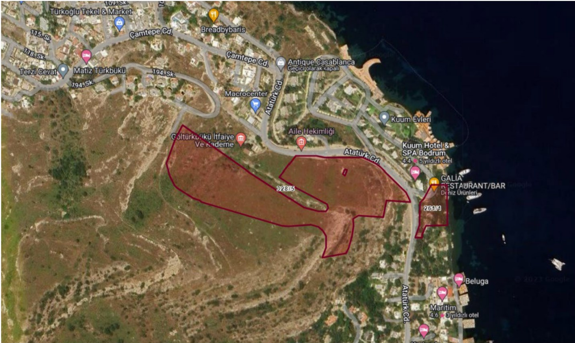
Tablo 17. PSGYO Next Level Bodrum Proje Görünümü

Değerleme detayları (Tablo 18) ve (Tablo 19)'da gösterilmektedir.