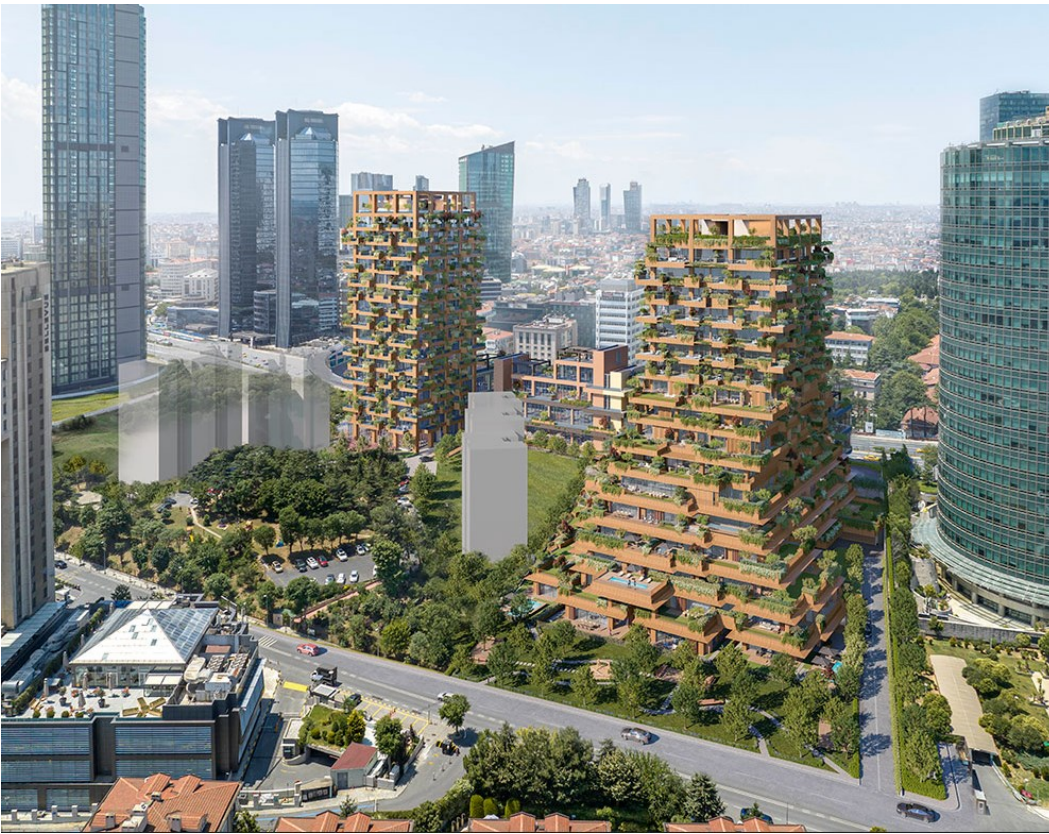
Tablo 5. PSGYO Next Level İstanbul Proje Görünümü

Değerleme detayları (Tablo 6) ve (Tablo 7)'de gösterilmektedir.