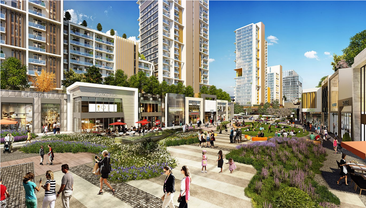
Tablo 14. PSGYO Merkez Ankara Proje Görünümü

Değerleme detayları (Tablo 15) ve (Tablo 16)'da gösterilmektedir.