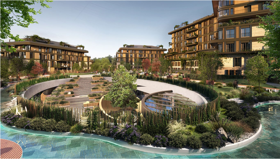
Tablo 8. PSGYO Next Level Kemer Proje Görünümü

Değerleme detayları (Tablo 9) ve (Tablo 10)'da gösterilmektedir.