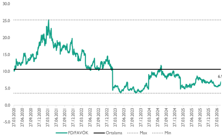
Grafik 1: Tarihsel FD/FAVÖK Çarpanı