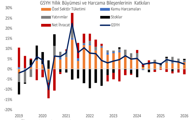
Kaynak: TÜİK, TSKB Ekonomik Araştırmalar

2026 yılı ilk çeyrekte büyüme rakamları hem yıllık hem de çeyreklik bazda bir önceki çeyrek gelişmelerinin altında kaldı ve ekonomide yavaşlamanın sürdüğüne işaret etti. Son beş çeyrekte olduğu gibi iç-dış talep dengesindeki bozulma bu dönemde de sürdü. Büyümeyi iç talep sürüklerken, net dış talep büyümeye negatif katkı yapmaya devam etti. Özellikle reel ihracatta yılın ilk çeyreğinde sert bir daralma yaşanırken, bu daralmanın büyümeyi 2,9 yüzde puan aşağı çektiği görüldü. Yatırımlar tarafında büyümenin yavaşlansa da pozitif bölgede kalması dikkat çekti. Sanayi üretiminde yıllık büyüme ivme kaybetmeyi sürdürürken, tarımda bir miktar toparlanma gerçekleşti. 2026 yılının ikinci çeyreğine ilişkin öncü veriler aktivitenin bir önceki çeyreğe kıyasla görece yatay bir seyir izlediğini ortaya koyuyor. 2026 yılında büyüme üzerinde aşağı yönlü risklerin canlı kaldığı görülüyor. Şubat ayı sonunda başlayan savaş ve enerji fiyatlarındaki yükselişin küresel ekonomik büyümeyi yavaşlatarak dış talep koşullarını olumsuz etkileyebileceğini düşünüyoruz. Ayrıca, yurtdışında hem küresel gelişmeler hem de son haftalarda yaşanan politik gelişmeler nedeniyle finansal koşulların daha uzun süre sıkı kalacağını değerlendiriyoruz. Bunun da yıl boyunca iç talebi sınırlayabileceğini öngörüyoruz. Bu değerlendirmeler ışığında 2026 yılında büyümenin geçtiğimiz yıl seviyesinin bir miktar altında gerçekleşebileceğini tahmin ediyoruz.