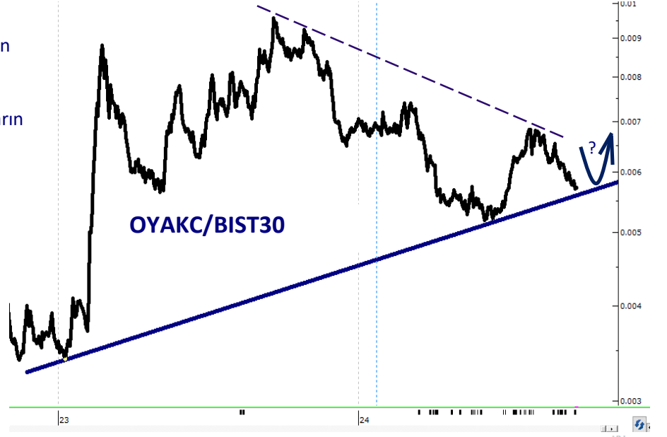
OYAKC Günlük TL Grafik