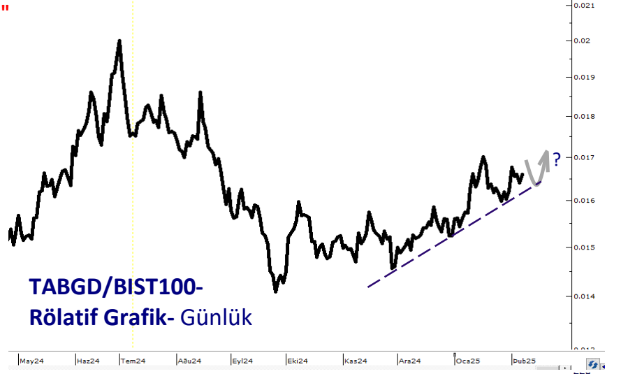
TABGD/BIST100- Rölatif Grafik- Günlük